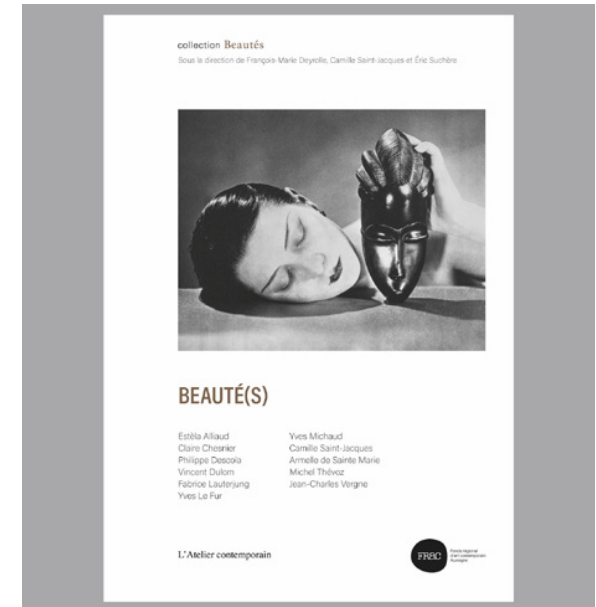
Estela Alliaud, La Part qui échappe Beauté(s), co éd. L'atelier contemporain / FRAC Auvergne, 2023, 102 p. [en librairie]